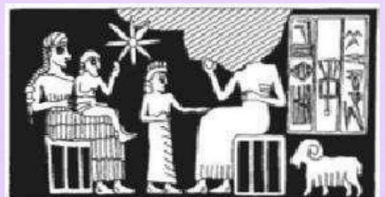
Presencia de mujeres en algunos monumentos del antiguo Kurdistán (especialmente en Urkesh) en el tercer milenio a.C.