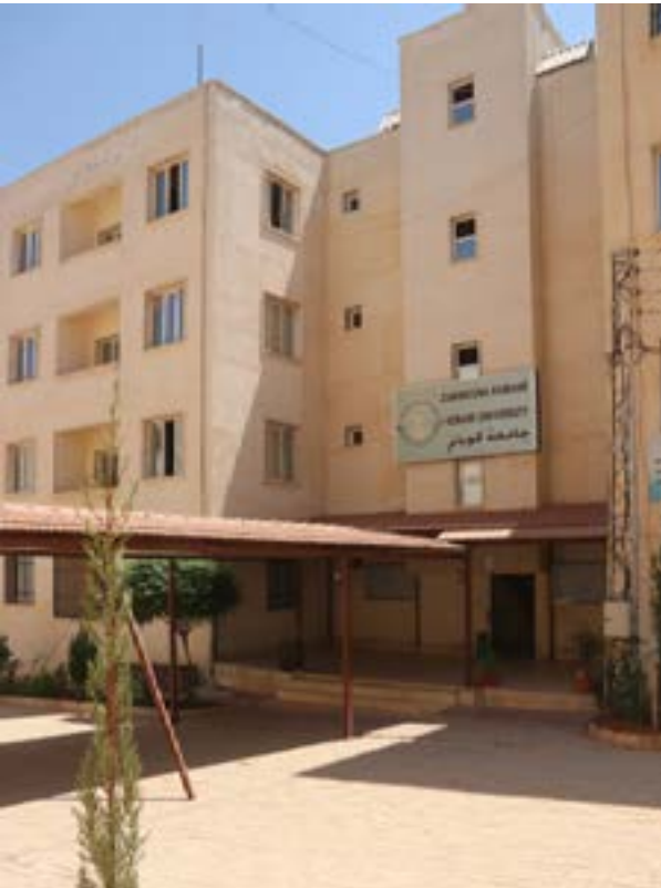
Entrada a la Universidad de Kobane en el verano de 2022. A partir de 2023, la universidad se trasladará a otro edificio, y sus antiguas salas se utilizarán para alojar a los estudiantes de fuera de la ciudad.

Decenas de profesoras de todo el mundo han ofrecido clases online, y al menos un cierto número han venido al NES para dar clases presenciales, según la responsable del departamento. Otros departamentos ofrecen programas similares de profesoras invitadas, aunque todavía no se han formalizado a través de instituciones de educación superior. En Kobane, la mayor parte del profesorado de máster lo hace en línea, según la administración de la universidad.