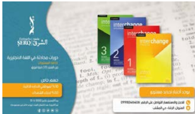
Anuncio de las clases de inglés que se imparten en la Universidad de al-Sharq. Los empleados de la AANES reciben un 10% de descuento, mientras que hijas e hijos de combatientes caídos sólo pagan la mitad del precio

Asimismo, la Universidad de Kobane ha creado una amplia cartera de departamentos especializados, como el de Lengua y Literatura (tanto en kurdo como en árabe), así como departamentos de Ciencias Sociales, Educación, Matemáticas, Física, Química, Biología y Medicina. Además, cuenta con facultades de Geografía y Tecnología (que ofrece titulaciones de dos años y medio en Ingeniería Eléctrica y Mecánica), así como institutos de Lengua Inglesa, Administración y Derecho, y un Instituto Médico que ofrece cursos de Enfermería y Anestesiología. En enero de 2022, puso en marcha un Instituto de Estudios de Posgrado. Ofrece un Máster en Lingüística y Literatura Kurda. Hay 28 estudiantes matriculadas en este programa.