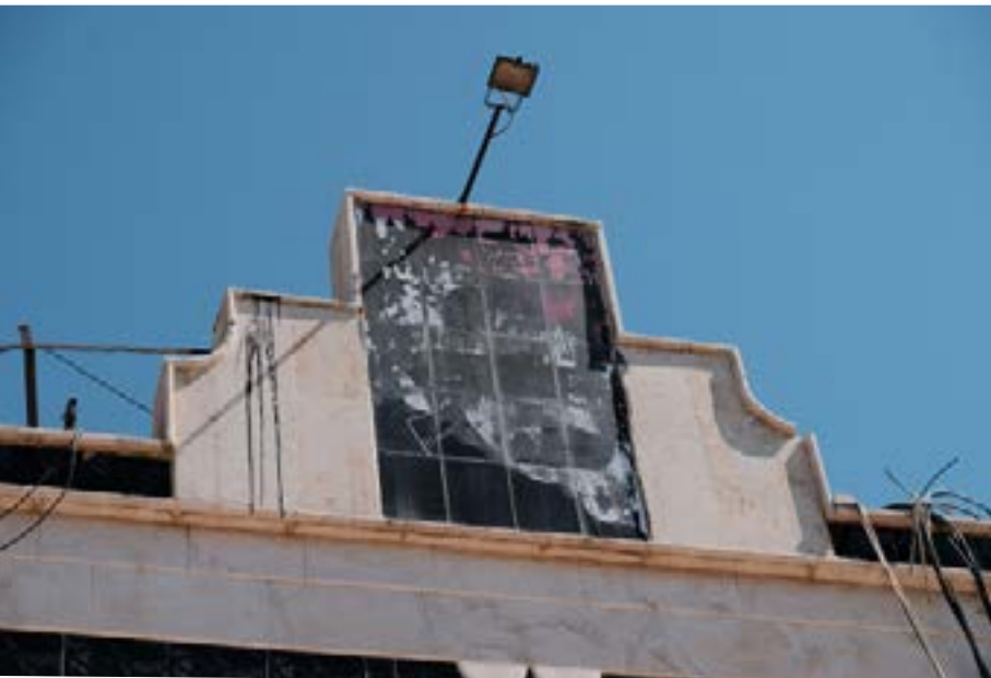
Una fotografía borrada del presidente Bashar al-Assad en el campus de la Universidad de Rojava en Qamishlo delata el antiguo uso del edificio

de los estudiantes de cada departamento, que forman parte de los consejos junto con los profesores. Los consejos de estudiantes gestionan los asuntos estudiantiles. Organizan las acciones de los estudiantes, reuniones, debates, recoge sugerencias, y se encargan de las celebraciones en ocasiones especiales. Dentro de cada consejo hay también diferentes comités, como deportes o música.