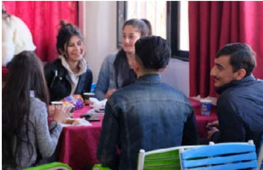
Estudiantes disfrutan de un café en la cafetería de la Universidad de Rojava

Las universidades del NES están abiertas a todas las personas que viven en el NES. Las aspirantes a estudiantes tienen que solicitar su ingreso a través del Departamento de Educación y se les invita a realizar un examen estandarizado basado en sus notas de bachillerato, que determina qué cursos están abiertos para ellas. El examen de acceso, que dura unas 3 horas, puede realizarse en todas las universidades del NES, así como en un centro de pruebas adicional en Shehba, el enclave controlado por la AANES al norte de Aleppo. El examen versa en ciencias generales o humanidades, en función de las opciones de la solicitante. Las preguntas del examen se formulan en kurdo y en árabe, y las respuestas se consideran válidas en cualquiera de los dos idiomas. Los resultados del examen determinan si las solicitantes son aceptadas en los cursos deseados. Para Traducción al inglés, es necesario un examen adicional de competencia en inglés. Una vez que una estudiante ha sido aceptada en el sistema universitario del NES, puede elegir libremente en cuál de las tres universidades quiere estudiar. Según la Comisión de Coordinación de Universidades, el órgano de la AANES que organiza estas universidades, 2.624 estudiantes se presentaron a las pruebas de acceso para el curso 2021/2022. Esto incluye 1.640 en Qamishlo, 637 en Kobane, 86 en Shehba y 261 en Raqqa.