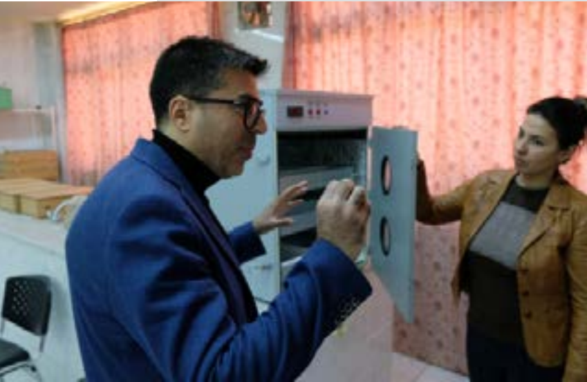
El personal enseña el laboratorio del Departamento de Ingeniería Agrícola a las visitantes

En una región considerada el "granero" del país, que sufre escasez de agua, desertificación y falta de semillas de calidad, la ampliación del Departamento de Ingeniería Agrícola representaría un paso fundamental para que el Norte y Este de Siria sea autosuficiente.