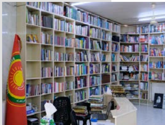
Biblioteca de la Universidad de Rojava

Las estudiantes de la Universidad de Rojava deben obtener un certificado de competencia lingüística B1 para poder graduarse con una licenciatura. Para las estudiantes de Máster, el requisito es el nivel C1. Las estudiantes pueden obtener su certificado tomando 3 horas de clase de inglés cada semana. Un Centro de Idiomas perteneciente a la universidad ofrece clases de inglés a las estudiantes universitarias después de sus clases. Cada nivel del Marco Europeo de Niveles Lingüísticos (A1, A2, B1, B2, C1) se completa tras 30 horas de enseñanza.