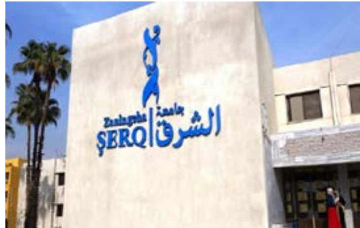
Entrada de la Universidad al-Sharq en Raqqa. Al fondo se aprecia un edificio de residencia de estudiantes.

Al-Sharq, que ofrece los salarios más altos de las tres universidades, paga a las profesoras un promedio 200 dólares (o alrededor de 800.000 libras sirias en julio de 2022) al mes. "Algunos profesoras y profesores", explica el Dr. Hasan al RIC, "tienen que ser contratadas de forma privada" y se les paga hasta 1.000.000 libras sirias (o 250$) además de los gastos de vivienda. En una región donde el salario promedio del funcionariado público en el NES es de 300.000 libras sirias (75$) y casi la mitad de esa cantidad en los puestos del gobierno de Siria, esos salarios pueden resultar muy atractivos. Sin embargo, las administraciones de las universidades dicen que necesitan más fondos de la AANES. "Queremos que vengan profesorado de calidad y enseñen; algunas personas vienen de muy lejos", enfatiza el Dr. Hasan de al-Sharq.