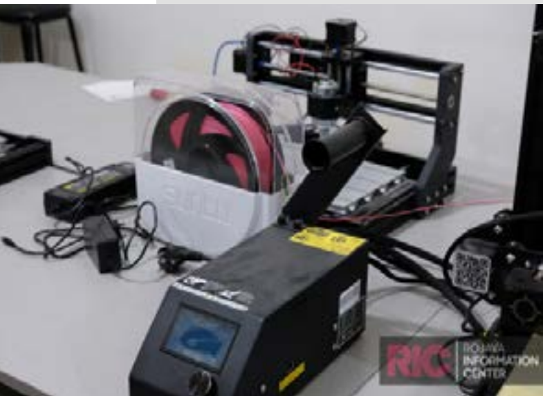
Impresora 3D del Departamento de Mecatrónica de la Universidad de Rojava.

Las profesoras Basil y Siham mostraron al RIC diferentes proyectos diseñados por alumnas de tercer año: Un coche de bomberos que lleva incorporados sensores capaces de detectar incendios; una "casa inteligente" a pequeña escala controlada desde una aplicación de móvil; y, probablemente, el proyecto que más llama la atención: