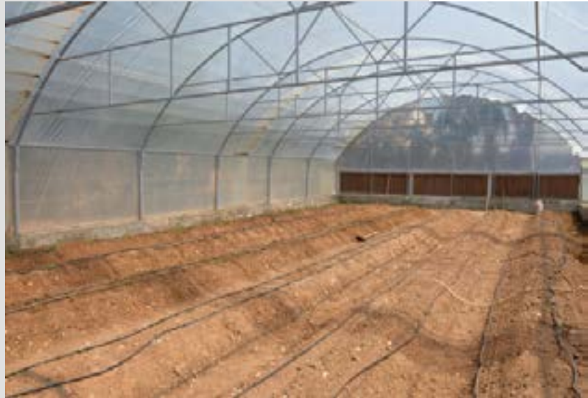
Invernadero de la Universidad de Rojava, ubicado en el campus de Qamishlo

La tierra del huerto del campus de Qamishlo está disponible para que las estudiantes experimenten y lleven a cabo sus propias investigaciones. Las estudiantes de cuarto año de ingeniería agrícola investigan en el invernadero principal. Aquí pueden experimentar con la producción de alimentos. Por ejemplo, han producido champiñones ostra.