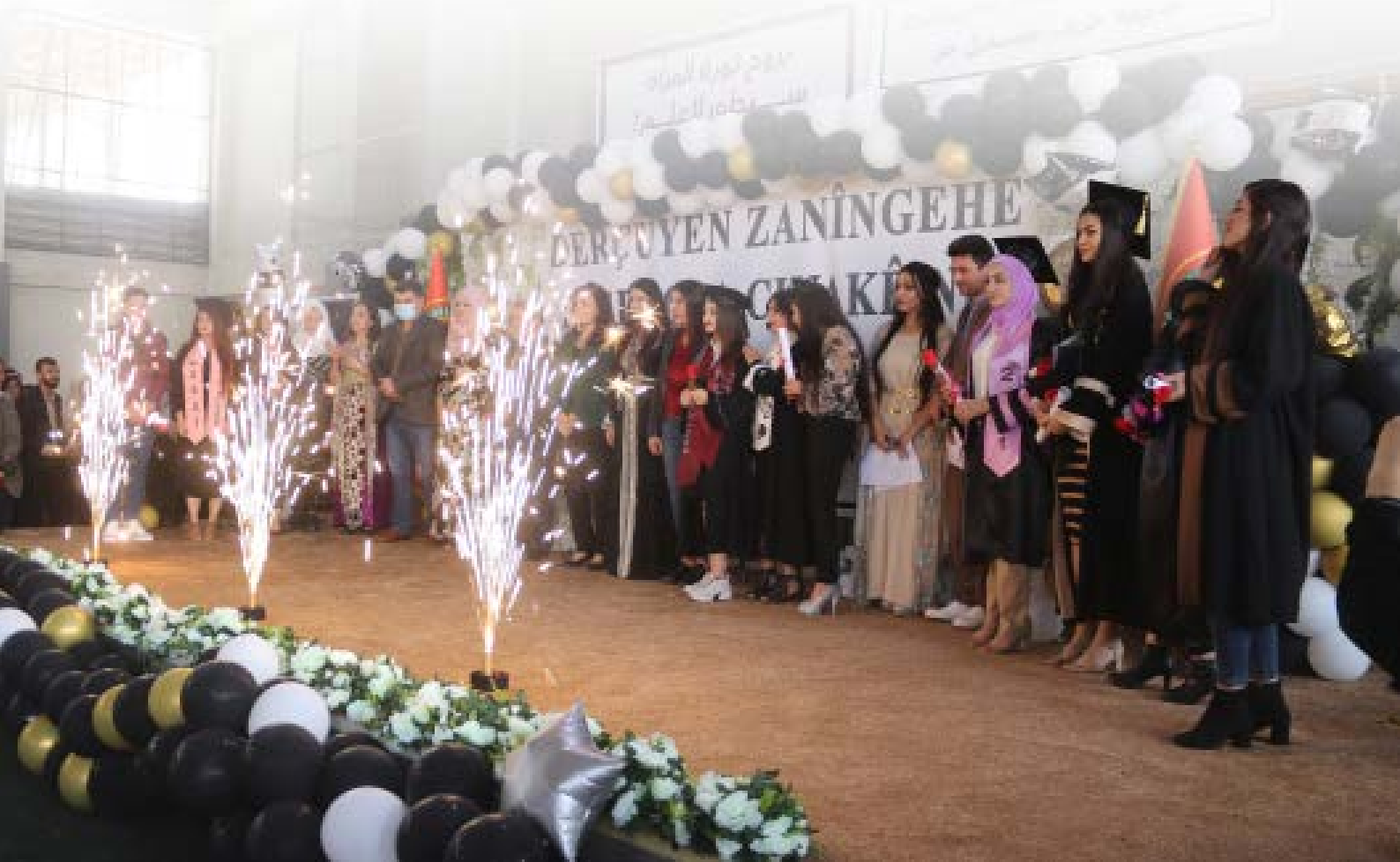
Ceremonia de graduación en la Universidad de Rojava en el otoño de 2021