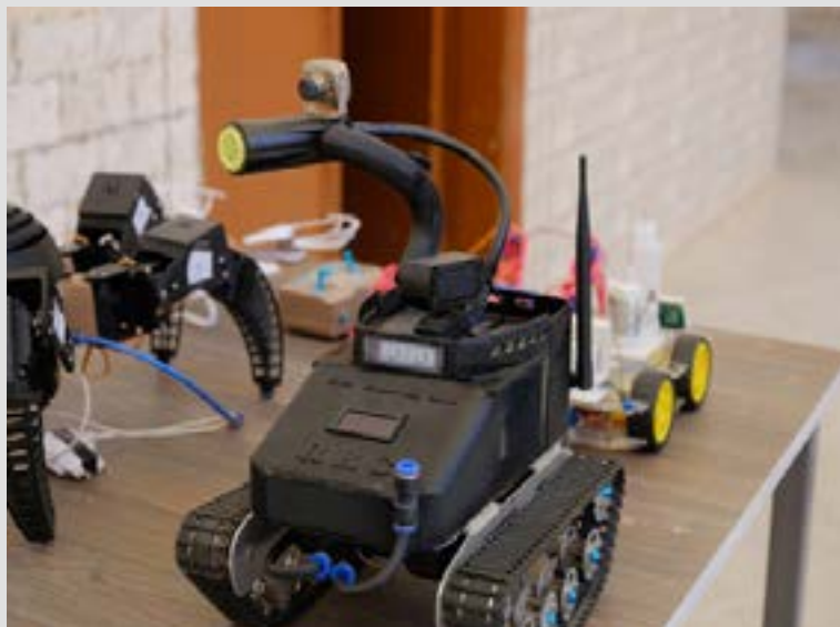
Proyectos finales de las estudiantes de 2022: un robot bombero, una araña robot y un dron.

Sin embargo, las aspiraciones de autonomía van más allá de lo material. Reflejando los valores de sistema de autonomía de la AANES y de la universidad, las profesoras subrayan la necesidad de poder desarrollar sus propios sistemas tecnológicos, sin depender de actores externos. Mientras el RIC visitaba sus dependencias, las profesoras estaban enfrascadas en una discusión sobre el uso de microcontroladores de placa única ya preparados, y la mejor alternativa: utilizar microcontroladores sin programar, programarlos en el Departamento de Mecatrónica y utilizarlos para sus propios fines.