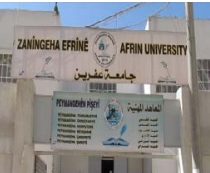
La Universidad de Afrín (en la foto) se estableció en 2015 y se vio obligada a cerrar cuando Turquía invadió la región en 2018. Hoy en día el edificio alberga el Consejo de Afrín, un gobierno delegado turco en la región.