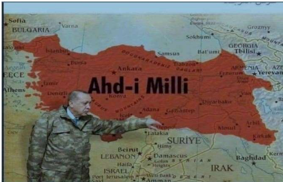
El sueño de la Gran Turquía: Misak-ı Millî, antes llamado Ahd-i Milli Beyannamesi / Pacto Nacional

Entre los actores regionales, el Estado turco desempeña un papel clave por su apuesta básica de asegurar sus intereses estratégicos. El actual Estado turco cree que puede reconstruirse sobre la base de los antiguos territorios del Imperio otomano. El presidente turco, Recep Tayyip Erdogan, ha dejado claro en los últimos años su sueño de crear una Gran Turquía, según lo previsto por el Misak-ı Millî (Pacto Nacional o Juramento Nacional) de 1921. Este Pacto Nacional reclama dos antiguas provincias otomanas como patrimonio de Turquía: Aleppo (Rojava / NE de Siria) y Mosul (KRG, Irak). Paralelamente a esto, el Estado turco sigue actualmente su estrategia de imperialismo y ocupación en todas las regiones árabes en Oriente Medio, pero particularmente en el norte de África, aunque también en muchos otros países de África y Asia. En Oriente Medio, el Estado turco cuestiona ahora las fronteras impuestas en la década de 1920, por lo que la soberanía de otros países es violada sistemática y repetidamente.