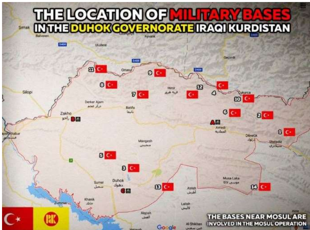
Algunas de las bases militares de Turquía en la región de Kurdistán del Sur / Irak

no quede aplastado, la ocupación y el genocidio podrán completarse en Kurdistán. Hoy, Turquía tiene más de 30 bases militares en el KRG.