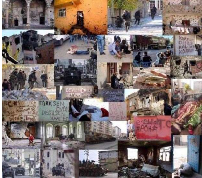
Implementación del “Plan de Destrucción” 2015 en Kurdistán del Norte (Turquía)