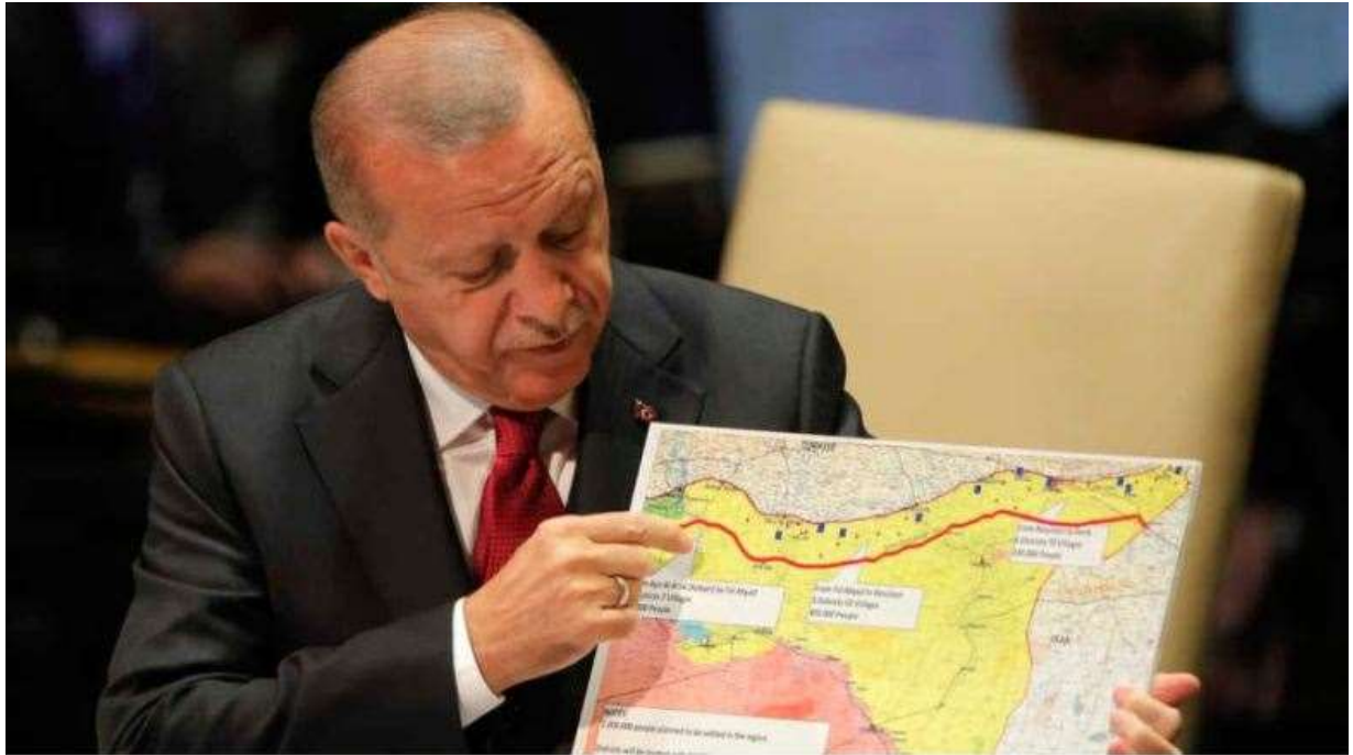
El presidente turco Erdogan sostiene un mapa del norte y este de Siria mientras habla durante la 74ª sesión de la Asamblea General de las Naciones Unidas el 24 de septiembre de 2019. Las áreas que muestra son las áreas que Turquía intenta ocupar.

La invasión y ocupación turca del norte de Siria es claramente contraria al derecho internacional. Nadie apoya abiertamente la invasión, pero la falta de una condena seria y legal fortalece la capacidad del Estado turco para continuarla.